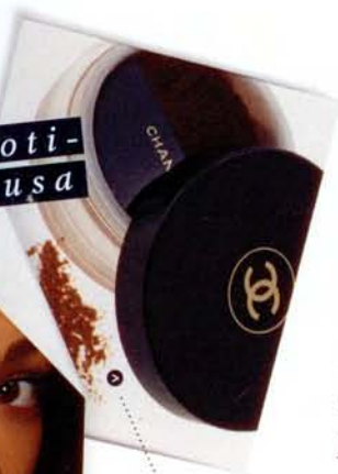
Kultaista hohdetta hipiään saat Chanel Soleil Tan De Chanel -aurinkopuuterilla, 62,50 e.

Sarjassa kerrotaan tämän hetken kiinnostavimmista malleista.