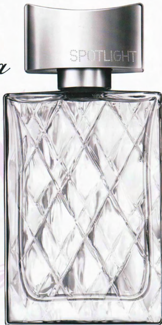
Avonin Spotlight on säikeäviävä tuulahdus jäätistä bergamottia. Näyttelijä Courtney Cox on vaniljaisen tuoksun kasvo ja esikuva. Hinta 35 € (50 ml).