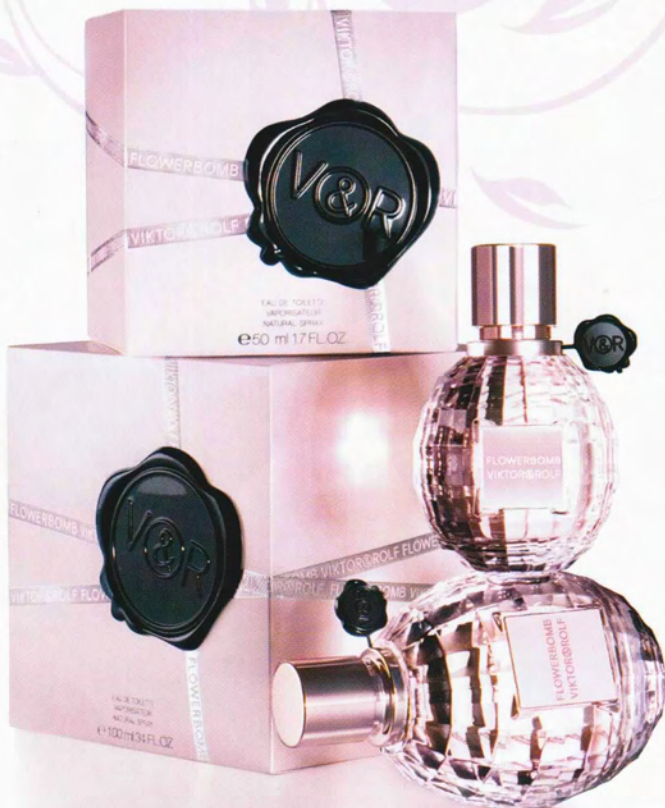
Victor & Rolf Flowerbomb –tuoksu on todellista luksusta.

Tuoksuvalmisteita ovat kauppojen hyllyt notkollaan. Hinnan sanelevat merkki, pakkaus ja ennen kaikkea tuoksuaineen määrä. Oikea parfyymi maksaa aina enemmän ja mitä enemmän sitä on sekoitettuna tuoksuvalmisteeseen, sen kovempi hinta. Tuoksu voidaan myydä Parfyymina, jos siinä on 20-40 % varsinaista tuoksuainetta. Mitä enemmän tuoksuainetta on, sitä vähemmän sitä myös kannattaa käyttää kerralla, ettei tuoksu liian voimakkaasti.